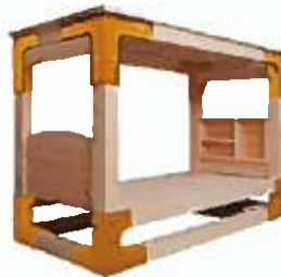
シングルサイズ用