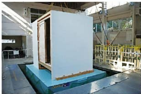
振動実験における装置全景