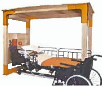
介護ベッド用シェルター